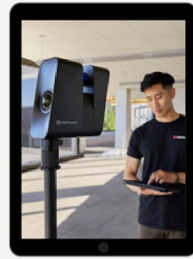
กล้องที่รองรับการใช้งาน Matterport